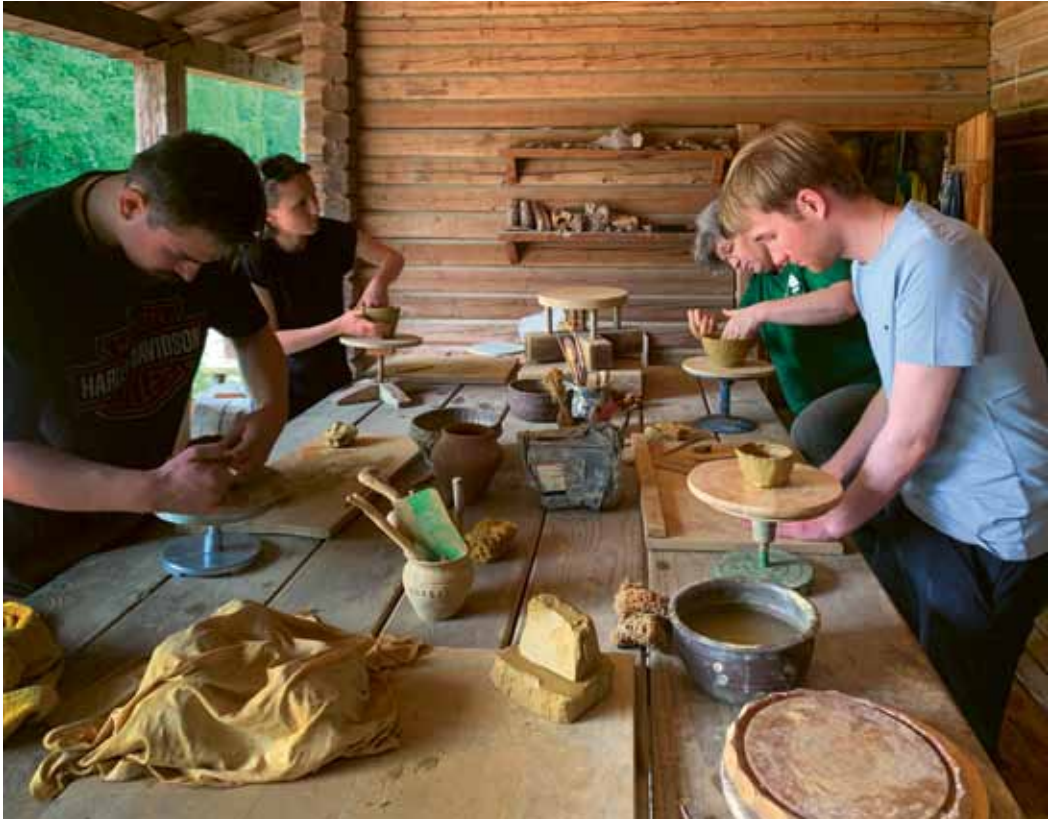
Abb. 3: Die Studierenden des Seminars für Experimentelle Archäologie der FU Berlin im Museumsdorf Düppel beim Töpfern im Juni 2022. Students during a module on experimental archaeology from the Free University of Berlin learning ceramic production in the Museum Village Düppel in June 2022.

zur Experimentellen Archäologie das Kennenlernen sowie die Bekanntmachung der Struktur des Seminars im Vordergrund standen. Es folgten zwei Vorlesungen, eine zur Geschichte der Archäologie und ihr Stand heute, die zweite zu Methodik und Aufbau eines wissenschaftlichen Experimentes. Hier konnten die ersten Grundlagen gelegt werden. Es folgte ein Handwerkerparcours im Museumsdorf Düppel, wo an zwei Terminen jeweils drei Gewerke ausprobiert werden konnten 4 . Dies war nur dank der fleißigen ehrenamtlichen Mithilfe von einigen Vereinsmitgliedern möglich. Einen herzlichen Dank an dieser Stelle! Am ersten Termin wurde gesponnen und gewoben sowie Weidenkörbe geflochten, im zweiten getöpft (Abb. 3), Bronze gegossen (Abb. 4) und Pech hergestellt.