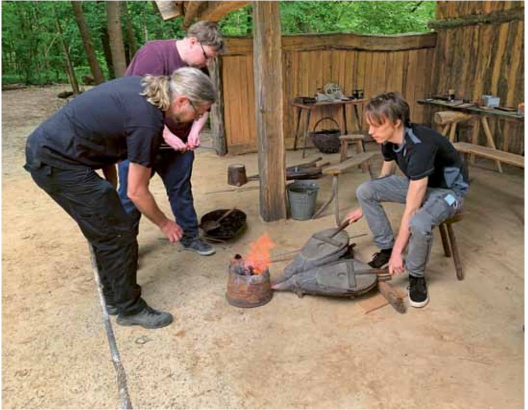
Abb. 4: Die Studierenden des Seminars für Experimentelle Archäologie der FU Berlin im Museumsdorf Düppel beim Bronzezuguss im Juni 2022.

Students during a module on experimental archaeology from the Free University of Berlin learning bronze casting in the Museum Village Düppel in June 2022.