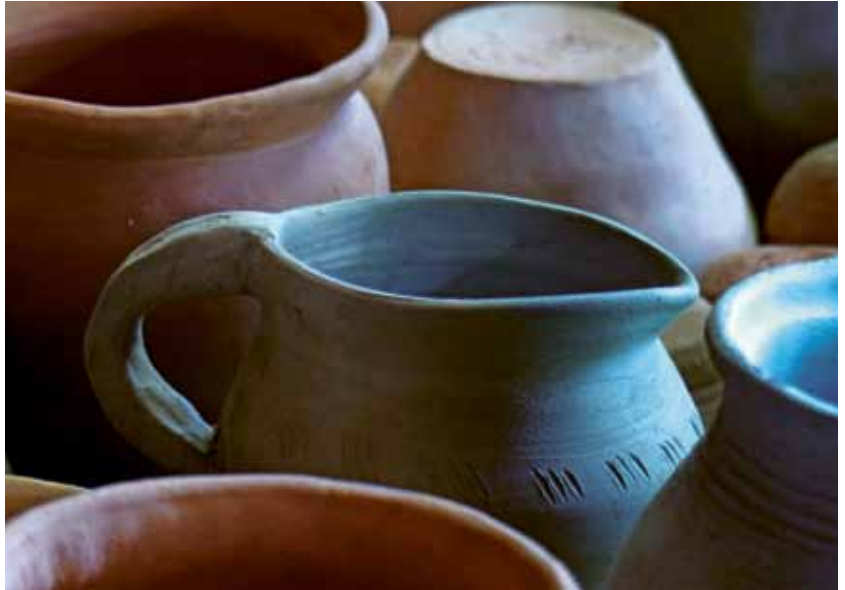
Pottery produced by volunteers of the ceramic group in the Musuem Village Düppel.

Das Erlernen einer historischen Technik kann anhand eines Modells aus der Entwicklungspsychologie veranschaulicht werden (Abb. 1). Die Kompetenzstufenentwicklung beschreibt die verschiedenen Phasen, die bei der Entwicklung von neuen Fertigkeiten durchlaufen werden ( www.wikipedia.org/wiki/Kompetenzstufenentwicklung ). Die erste Phase ist die „Unbewusste Inkompetenz“. Ohne praktische Erfahrung auf einem Gebiet vereinfacht unser theoretisches Denken die physische Realität, wie schon anhand von Van der Leeuw's Dualitätsprinzip beschrieben wurde. Die unbewusste Inkompetenz tritt ohne praktische Erfahrung verschärft auf – „es kann ja nicht so schwer sein“ – ist oft eine erste Reaktion, die in der Phase der unbewussten Inkompetenz häufig zum Ausdruck gebracht wird. Nach ersten praktischen Versuchen und der Entdeckung, dass es doch nicht so einfach ist, wird die Stufe der „Bewussten Inkompetenz“ erreicht. In dieser Phase ist es sehr verlockend aufzugeben, denn der Schritt zur „Bewussten Kompetenz“ ist bei den meisten Gewerken mit sehr viel Übung verbunden. Die letzte Stufe des Modells ist dann die „Unbewusste Kompetenz“, das Wissen wird mehr und mehr implizit, es steckt im Körper.